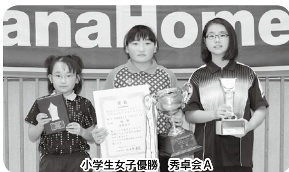
小学生女子優勝 秀卓会A