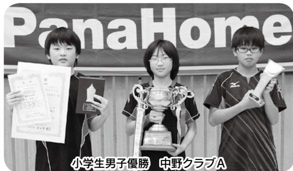
小学生男子優勝 中野クラブA