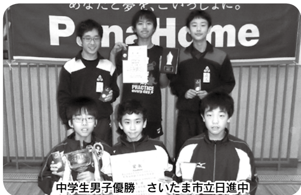
中学生男子優勝 さいたま市立日進中