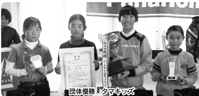
団体優勝 タマキッズ