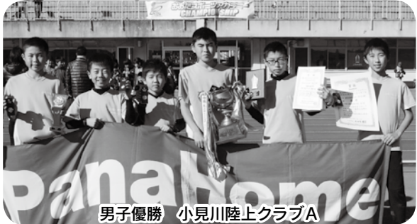
男子優勝 小見川陸上クラブA