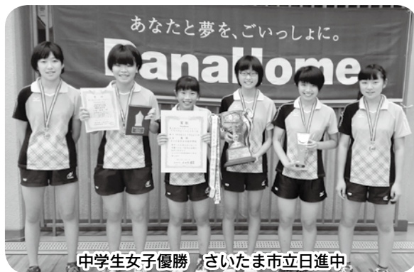
中学生女子優勝 さいたま市立日進中