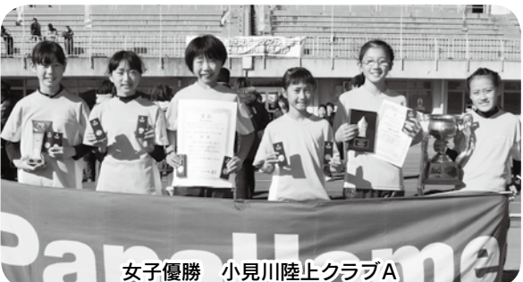
女子優勝 小見川陸上クラブA

第6回おおたスポーツアカデミー Championship 特別協賛/PanaHome 共催/上毛新聞社