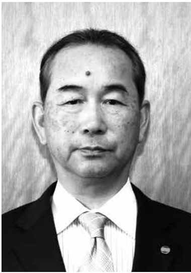
おおたスポーツアカデミー 校長