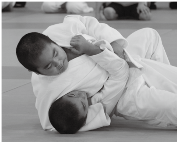
※先鋒(小学女子3年以上)・次鋒(小3)・五将(小4)・中堅(小5)・三将(小6)・副将(中学女子)・大将(同男子)の団体戦で行った。